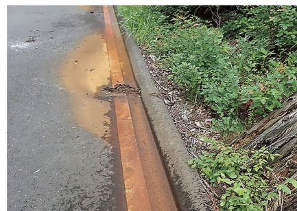
強酸性土壌に含まれる鉄分が溶脱し、赤褐色に染まった路面状況

植生基材袋と肥料袋により等高線の小段を形成するので、のり表面層の微粒土壌や植生基材の移動・流失を防止し、安定した植生基盤を築きます。