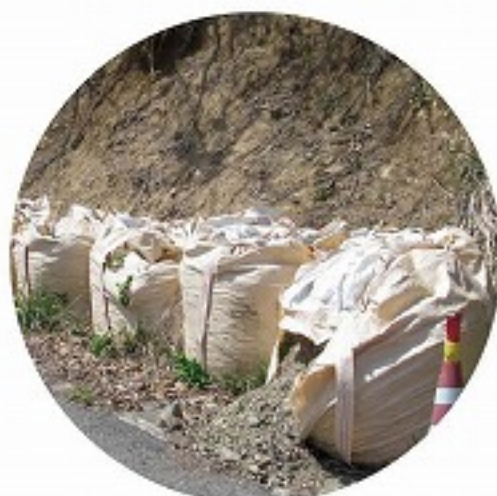
従来型の大型土のう

大型土のうは施工性の良さを活かして、緊急を要する災害復旧工事などにおいて広く一般的に用いられています。本製品は側面と上面にメッシュ生地を使用し、ここに種子と肥料等を装着していますので、土砂を充填して設置することで緑化が可能です。災害復旧と景観保全の機能を兼ね備えた、新しい防災緑化製品です。