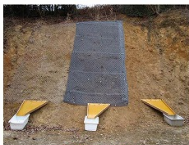
菱形金網のみ ドレーンシートR 裸地